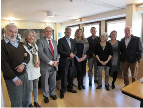
El ministre de Salut Pública amb la Consellera de Salut Patricia Gómez.