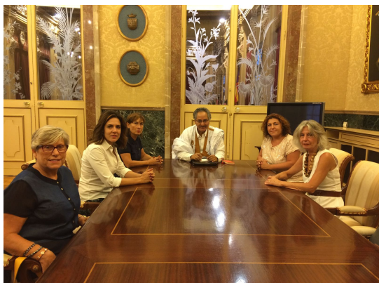
Reunió de l'Intergrup "Pau al Sahara" amb el Ministre de cooperació de la República Arab Sahraui Democràtica.