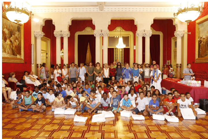
Visita dels infants del programa Vacances en Pau al Parlament de les Illes Balears